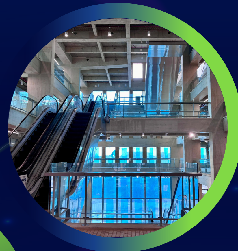
Todo en un mismo lugar