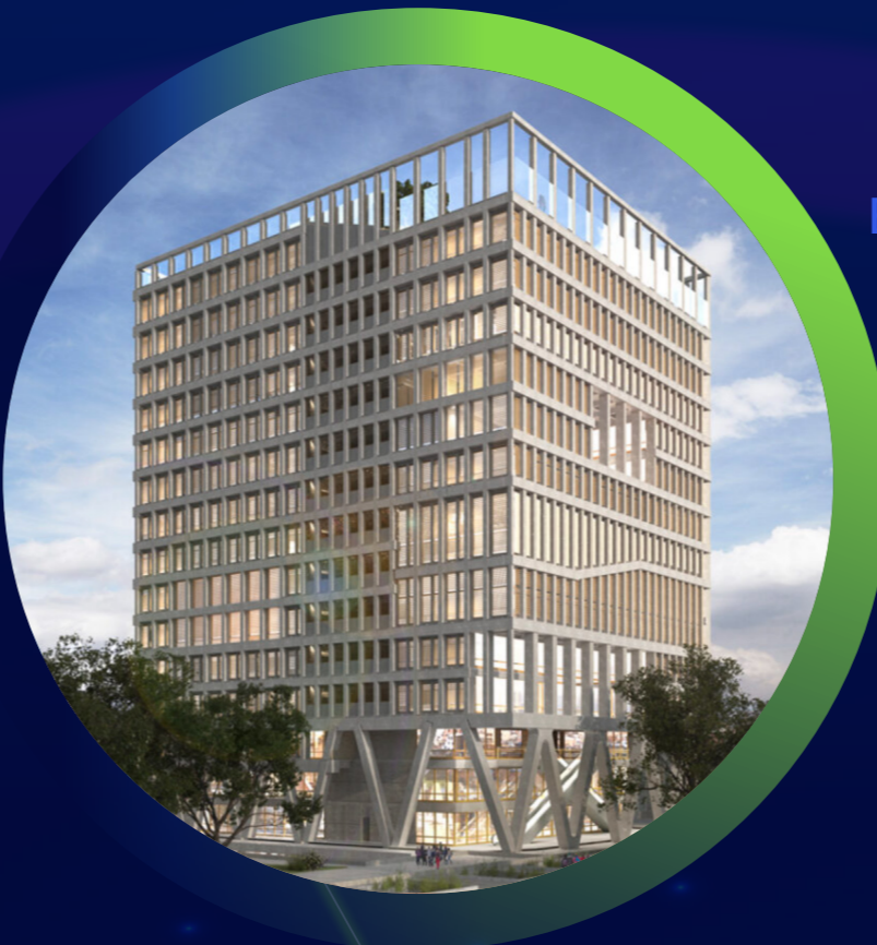
Equitectura educativa para el siglo 21